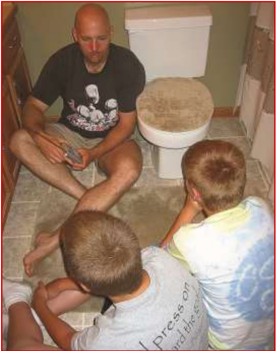
If you don't have a basement, a bathroom on the lowest floor of your home is a good place to seek shelter during a tornado. Be sure to take your weather radio into your temporary shelter.

እቲ ኮበርያ ምስሓላፊ፣ ዝወደቐ ናይ ጸዓት መስመራት ከይህልዉ ኣስተውዕልን ካብ ዝተሃሰዩ ቦታታት ርሒቑኻ ጽናሕን። ሓብሬታን መምርሒታትን ንምርካብ ከባቢያዊ ፊደሎን ቴሌቭዥንን ኣዳምጽ። ኣብ ትሕቲ ምድሪ ክፍሊ እንተዘይሃልዩካ፣ ኣብቲ ታሕተዎይ ደብሪ ዘሎ ክፍሊ መሕጸቢ ነብሲ ኣብ እዋን ኮበርያ ጽቡቕ መዕቆቢ ክኾነካ ይኽእል እዩ። ነቲ ግዝያዊ መዕቆቢኻ ፊደሎኻ ክትማለእ ኣለካ።