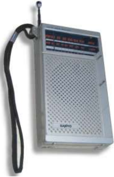
ብዛዕባ ኩነታት ክለማን ምቁራጽ ጸዓትን ሓበሬታ ንምርካብ ብባትሪ ዝሰርሕ ፊደዮ ሓዝ።